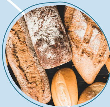
Dépôt de pain (sur commande)