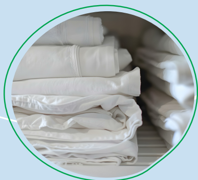
Location de draps*