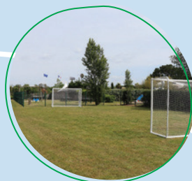
Foot / Basket